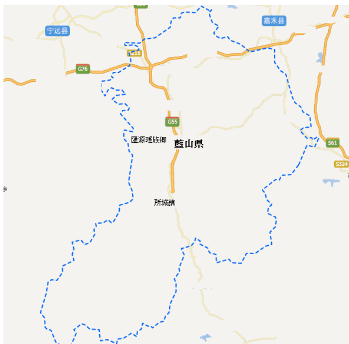
〈図4〉 湖南省永州市藍山県地図 2

第4項～第8項の神画資料は、筆者が課題「ヤオ族儀礼神画の研究」(2012年～2014年度神奈川大学日本常民文化研究所・非文字資料研究センターの奨励若手研究者)において、中国湖南省永州市江華瑶族自治县、及び広西壮族自治区恭城瑶族自治县で、2回ずつのフィールド調査を実施し、鄭艶瓊及び張晶晶の協力の下、江華瑶族自治县で2組、恭城瑶族自治县で3組収集できた神画の写真資料である。