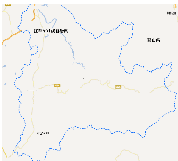
<図 5> 湖南省永州市江華瑶族自治県地図 11

総壇神画の銘文には、絵師は「陵武周国金」と記されている。本節の第 1 項で述べた趙金付氏が持っている太歳<太尉> (図 1-17) 神画には、「臨武周国珍」と記されているが、盤氏が持っていた総壇神画と趙氏が持っている太歳 (太尉神画) の銘文に書かれた絵師とは同じ人物ではないかと考える。前述したように、「臨武」は湖南省にある県名であり、藍山県の東部に位置する。「陵(líng)」と「臨(lín)」の発音が近いので、「陵武」は「臨武」の同音異字であると考えられる。また「金(jīn)」と「珍(zhēn)」の発音は近いので、「周国金」は「周国珍」の同音異字の可能性もある。あるいは、「周国金」と